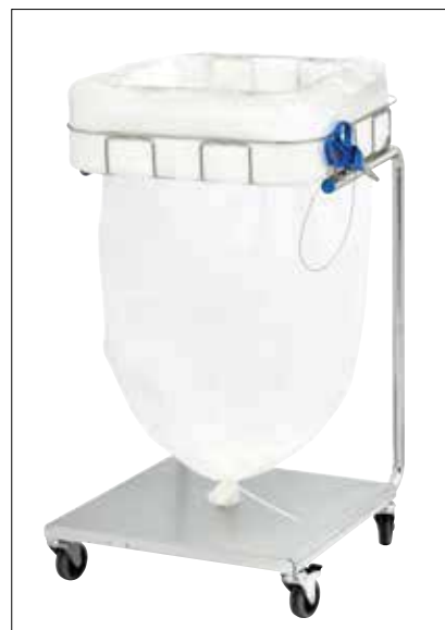
Stand Dynamic Maxi/Maxi Pedal