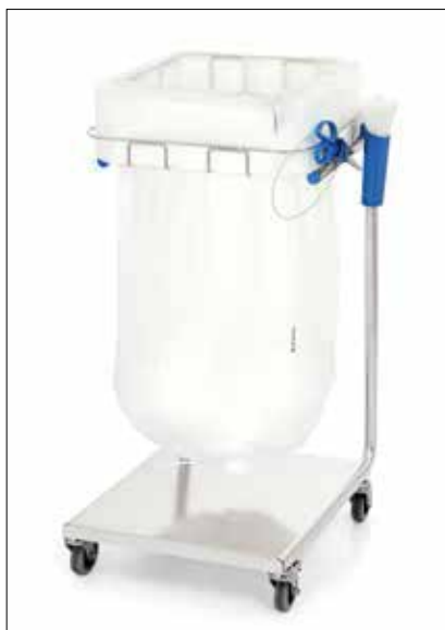
Stand Dynamic Midi/Midi Pedal