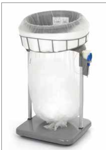
Stand Classic Maxi/Maxi Food