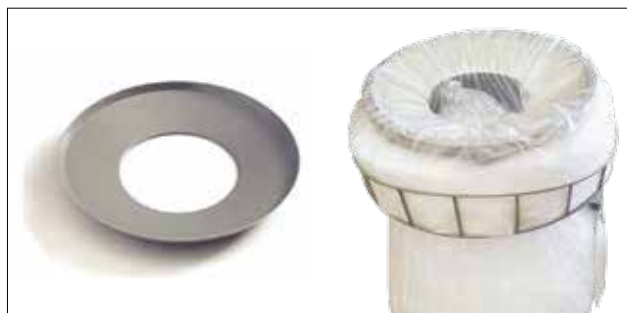
Hålskiva till Longopac Stand Classic Maxi Art. nr. 30170 Förminskar ikastöppningen vilket ger enklare komprimering av exempelvis returplast. Finns endast till Maxi.