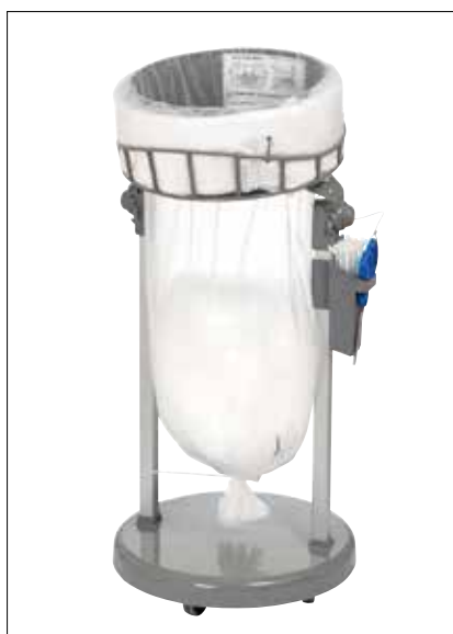
Stand Classic Mini/Mini Food