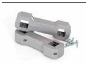
Ställkoppling till Longopac Stand Classic Art. nr. 33750 Kopplar på ett enkelt och stabilt sätt ihop två eller flera Longopac Stand. Det går även bra att koppla Maxi med Mini.