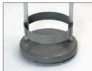
Sarg till Longopac Stand Classic Mini Art. nr. 33890 Sargen håller säcken på plats.