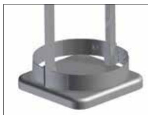
Sarg till Longopac Stand Classic Maxi Art. nr. 33900 Sargen håller säcken på plats.