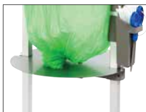
Adjustable plate till Stand Classic Mini Art. nr. 31480 Minskar förbrukningen av säckmaterial samt reducerar säckens storlek. Avsedd i första hand för klabbigt, tungt avfall. Kan med fördel användas till Bio-säckkassetter.