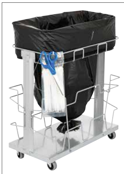
Stand Dynamic UBS