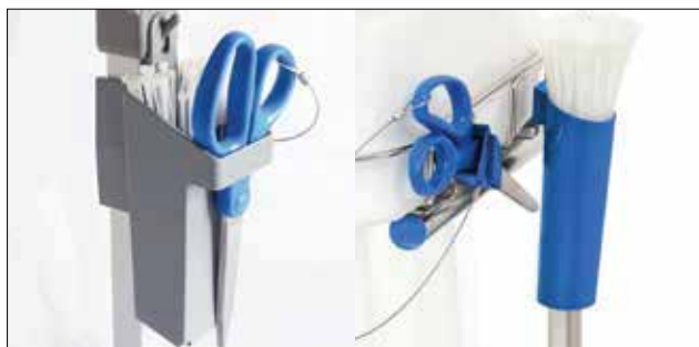
Buntbandshållare till Longopac Stand Classic Standard, grå. Art. nr. 30410 Metalldetekterbar, blå. Art. nr. 30416 Buntbandshållaren snabbar upp säckbytena ytterligare och håller buntbanden på plats. Passar både Maxi och Mini, och finns i två utföranden.