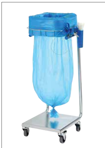
Stand Dynamic Mini/Mini Pedal