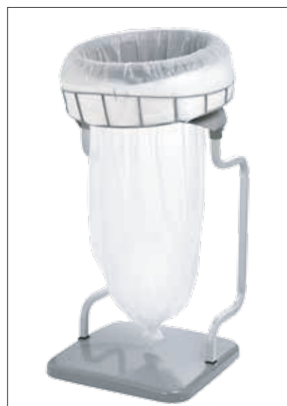
Stand Classic Recycling