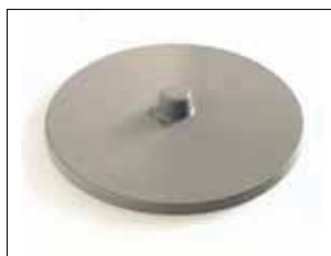
Lock till Longopac Stand Classic Maxi och Mini Mini. Art. nr. 31140 Maxi. Art. nr. 30140