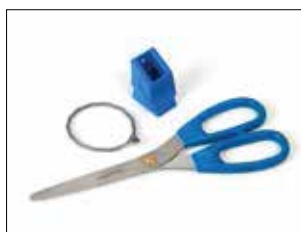
Saxkit till Longopac Stand Dynamic, metalldetekterbart Art. nr. 34609 Kit som innehåller metall-detekterbar sax, saxhållare, rostfri vajer.