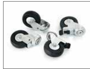
Stand Dynamic ESD Kit Wheels Art. nr. 34616 ESD kit innehåller fyra hjul, två med bromsar. Ersätter originalhjulena på ställen som används i ESD-begränsade områden.